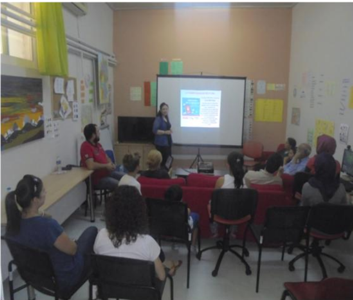
Φωτο: Οι επιμορφωτικές συναντήσεις στο Φιλοξενείο

Παρουσιάστηκαν διευθύνσεις ιστοσελίδων και τηλεφωνικές γραμμές βοήθειας για προβλήματα στο διαδίκτυο. Διανεμήθηκαν έντυπα του Σ.Σ.Ν. με χρήσιμες συμβουλές και κατατέθηκαν προτάσεις δημιουργικής αξιοποίησης του ελεύθερου χρόνου των παιδιών.