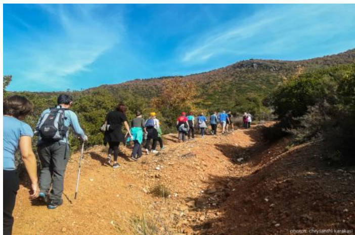
Η οικογενειακή φωτογραφία....